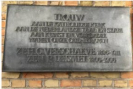
De gedenkplaat met de naam van de collaborator Cyriel Verschaeve aan de gevel van het college in Tielt.